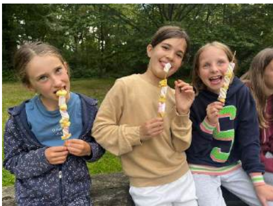
Voor onze vakanties brengen we ons aanbod voor kinderen en jongeren van 6 tot 16 jaar.

Vitaal staat uiteraard ook open voor kinderen die Nederlandstalig zijn en niet kwetsbaar zijn. Wij zetten in op het versterken van sociale vaardigheden, het opsporen van talenten en laten zo iedereen die deelneemt op een rijke manier groeien in zijn of haar zelfontplooiing.