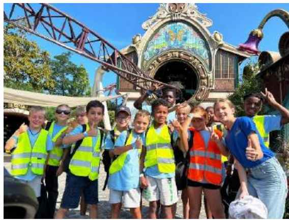
Een geweldige vakantie met leeftijdsgenoten aan een budgetvriendelijke prijs laat iedereen toe om deel te nemen. Ten strijde tegen sociale ongelijkheid.