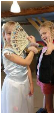
Op een speelse manier wordt het Nederlands versterkt in sport en spel. Deelnemers ontdekken hun talenten.