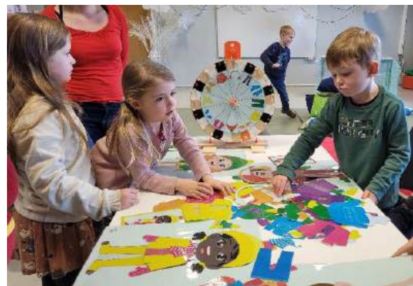
Onze taalrijke workshops doorheen het schooljaar zijn vooral gericht op kinderen van 4 tot 7 jaar.